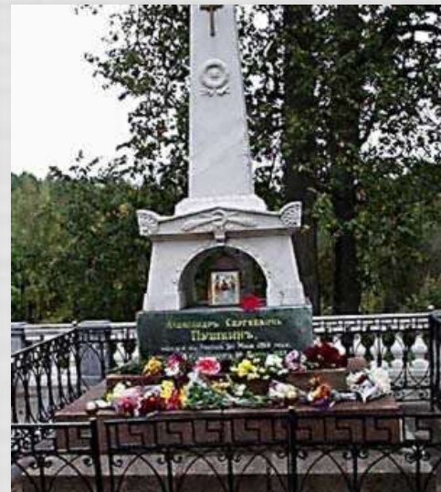
Могила А. С. Пушкина в наши дни